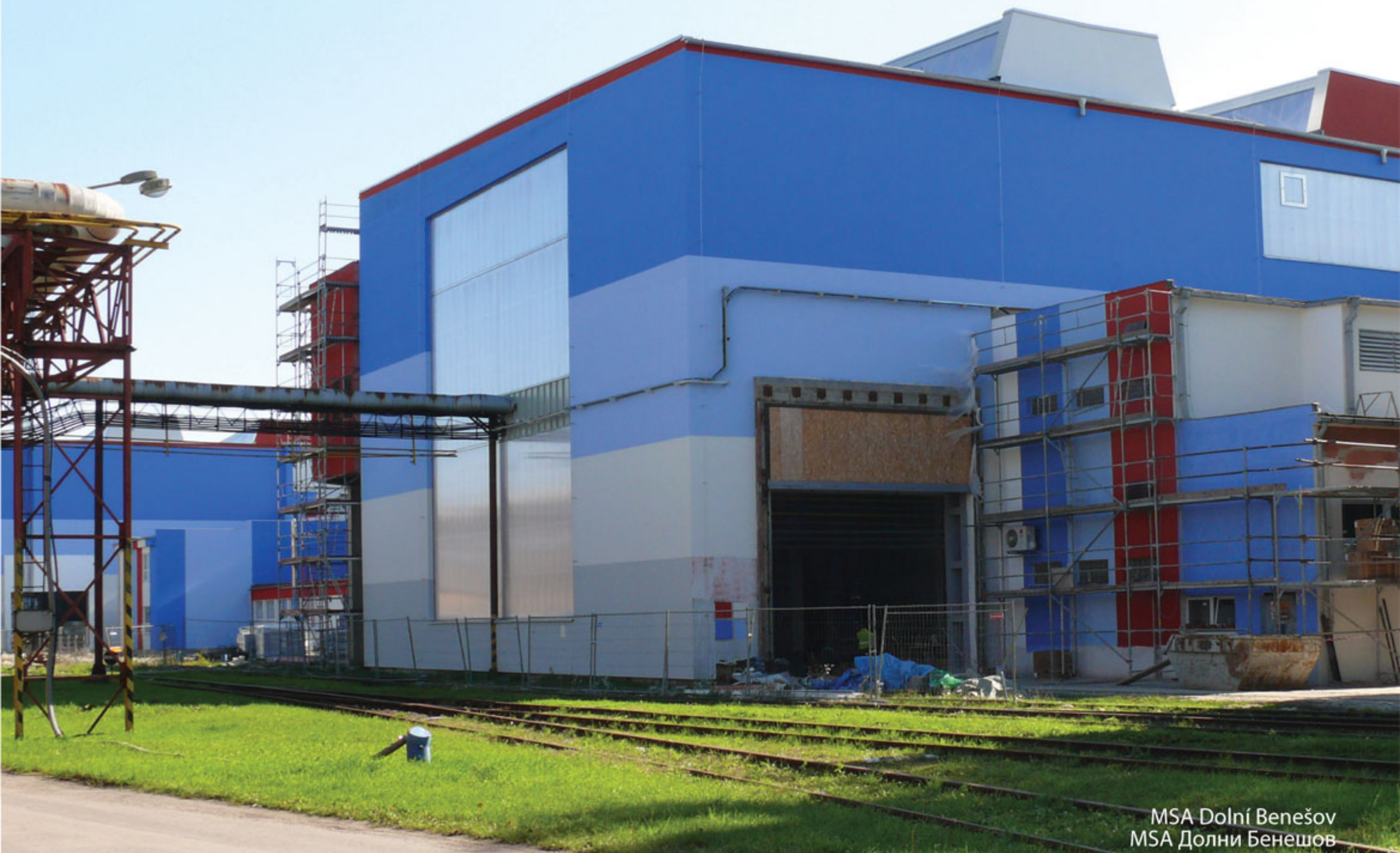
MSA Dolní Benešov MSA Долни Бенешов

По-новому, таким образом, задуманы и цели общества, которые теперь направлены на технологию добычи горных пород, на транспорт в горной промышленности, и на повышение безопасности труда в шахтах.