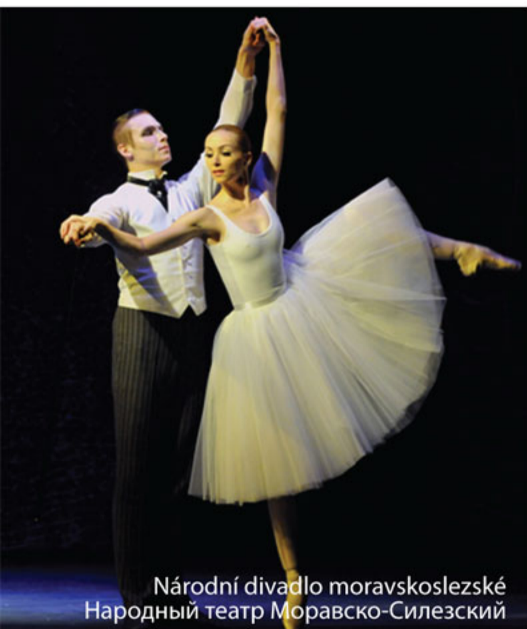
Národní divadlo moravskoslezské Народный театр Моравско-Силезский

Přátelský golfový turnaj v resortu SILGOR Kravaře nedaleko od Ostravy umožňuje účastníkům strávit den nejen v příjemném prostředí, ale především v atmosféře dobré zábavy. Ruské vlaječky na všech jamkách přitom připomínají, že turnaj se koná u příležitosti oslav státního svátku Ruské federace „Den Ruska.“