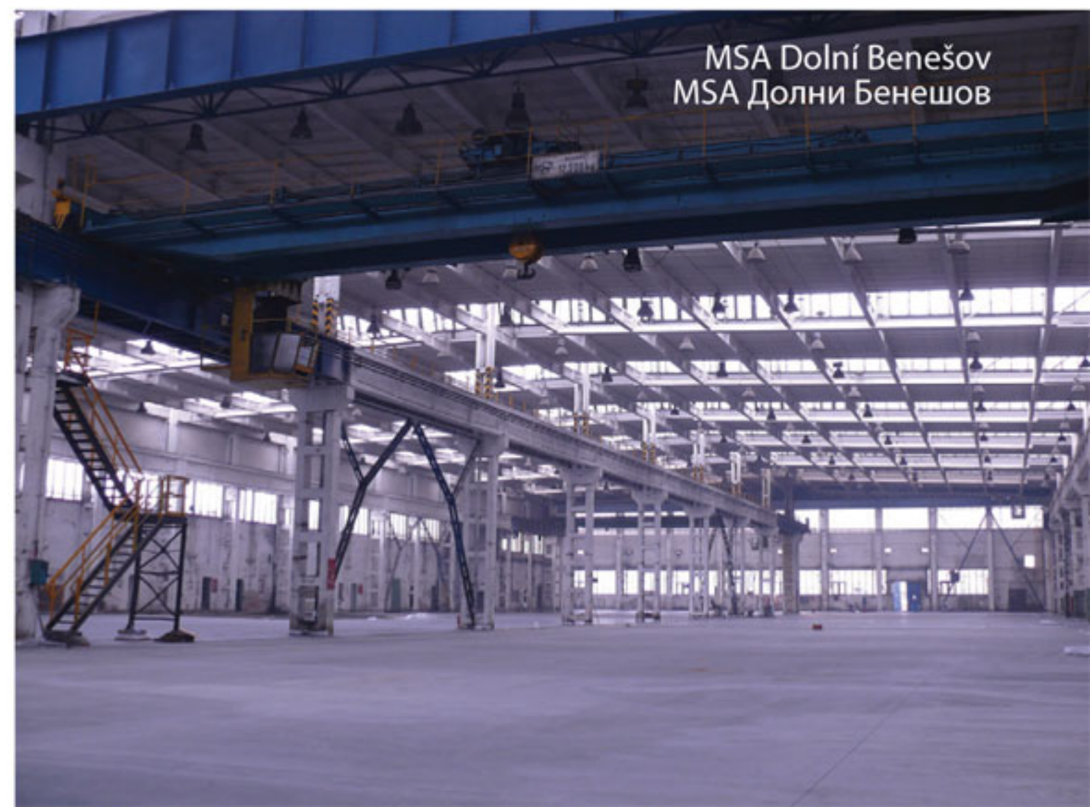
MSA Dolní Benešov MSA Долни Бенешов

RUSKÝ BYZNYS DEN mezinárodní konference 26. června 2014