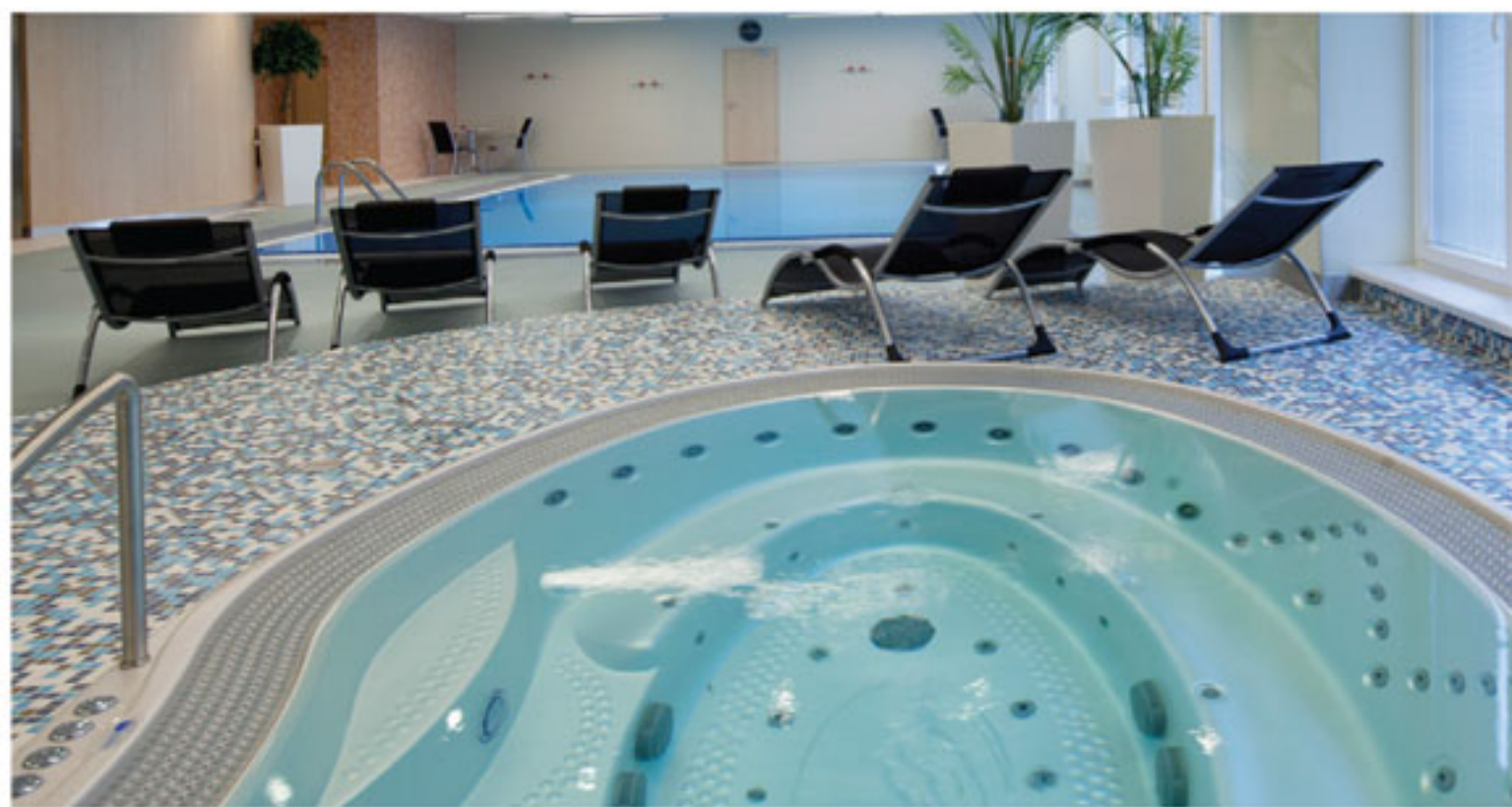
Clarion Congress hotel Ostrava Clarion Congress гостиница Острава

Сайт гостиницы предлагается на русском, английском и немецком языке: www.clarioncongresshotelostrava.com