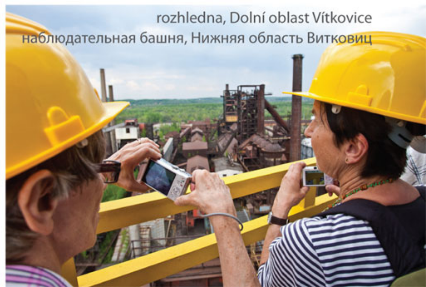
rozhledna, Dolní oblast Vítkovice наблюдательная башня, Нижняя область Витковиц

Из бывшего газоприемника был создан концертный зал, из Доменной башни наблюдательная башня.