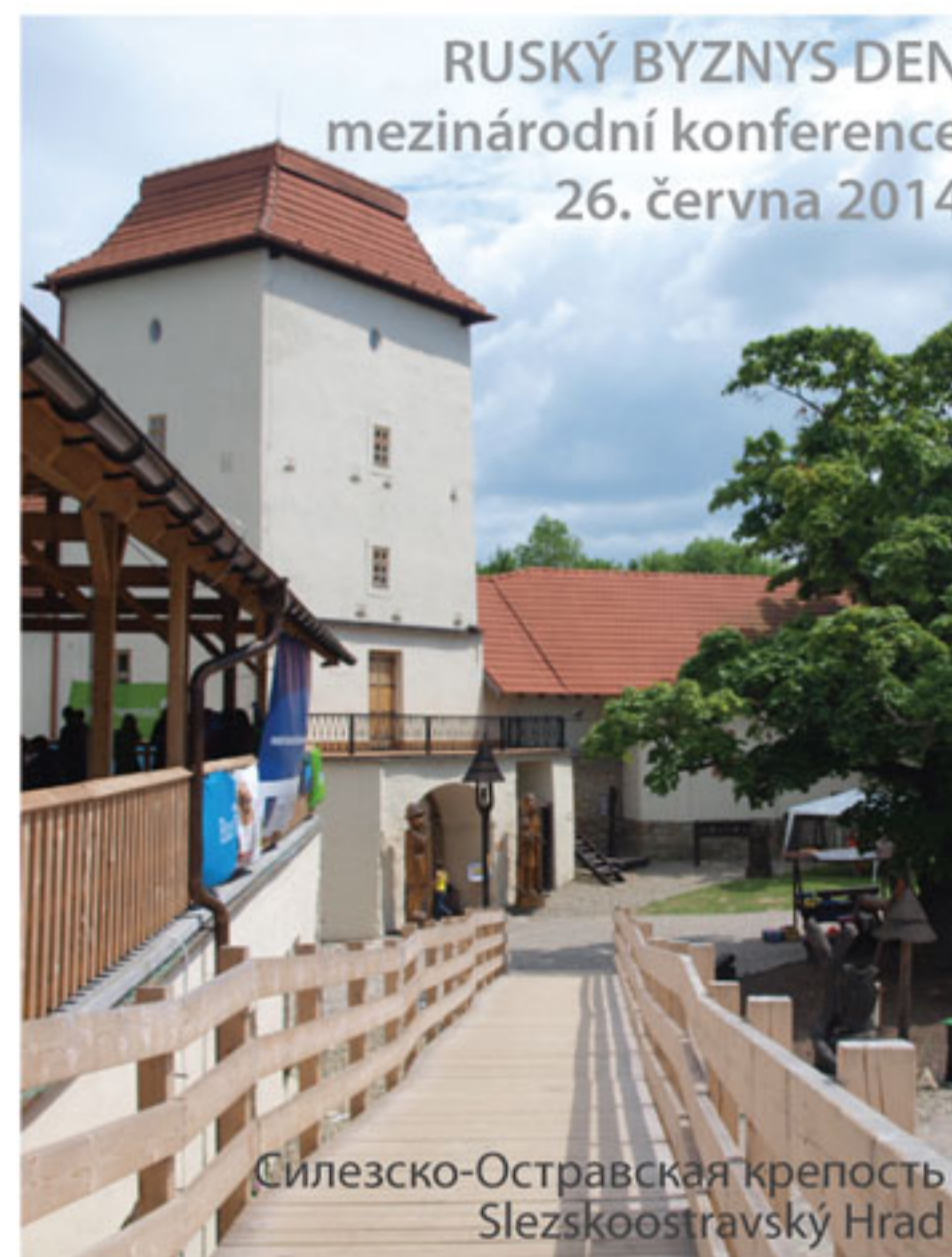
RUSKÝ BYZNYS DEN mezinárodní konference 26. června 2014