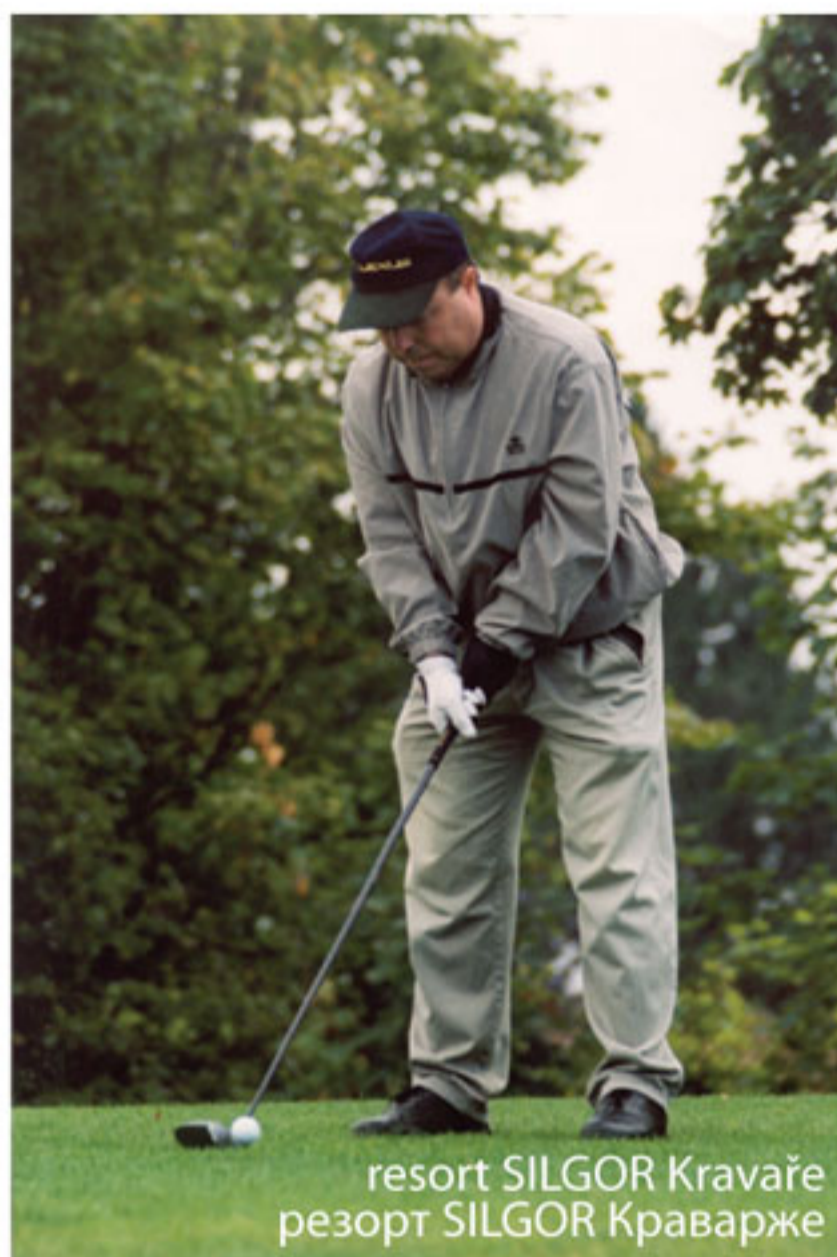
resort SILGOR Kravaře резорт SILGOR Краварже